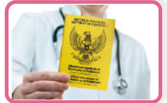
INTERNATIONAL CERTIFICATE OF VACCINATION (ICV)