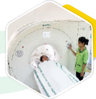
CT-SCAN 128 SLICES