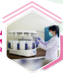
PEMERIKSAAN LABORATORIUM PENANDA TUMOR